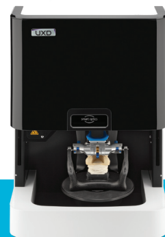
Smart Optics 10 (Vinyl UXD)