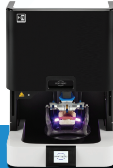
Smart Optics 9 (Vinyl High Resolution)