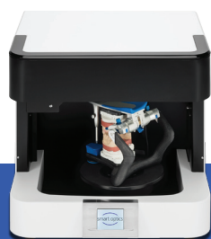
Smart Optics 3 (Vinyl Open Air)