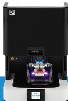
Smart Optics 9 (Vinyl High Resolution)