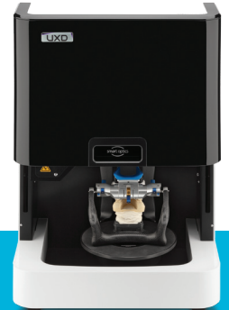
Smart Optics 10 (Vinyl UXD)